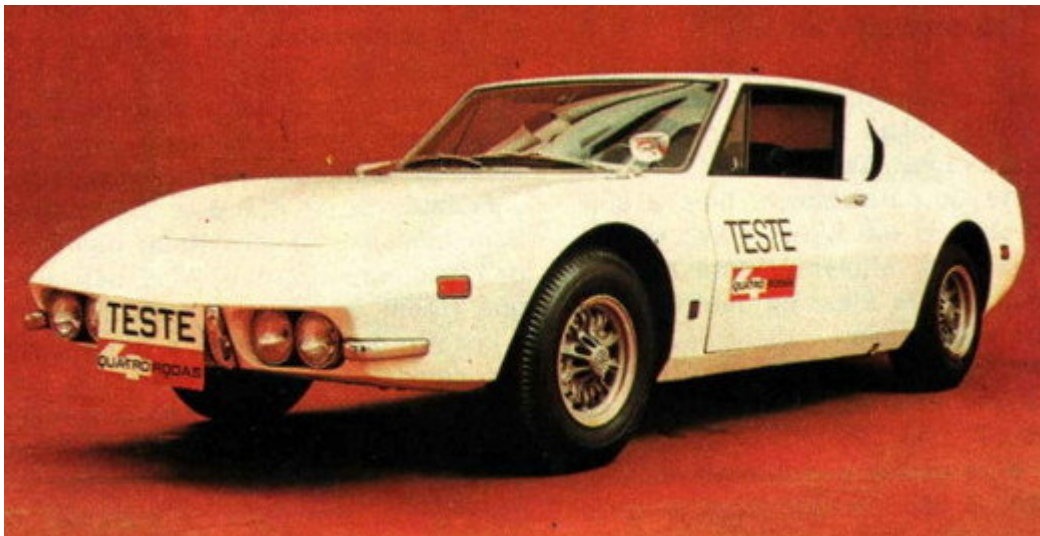
Um estranho Lorena, com as mais belas rodas do mundo

enviada por Gomes ( comentar | 17 comentários ) | ( envie esta mensagem ) | ( link do post )