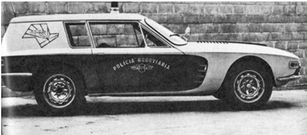
A lendária Gavião, perua Uirapuru, uma só feita