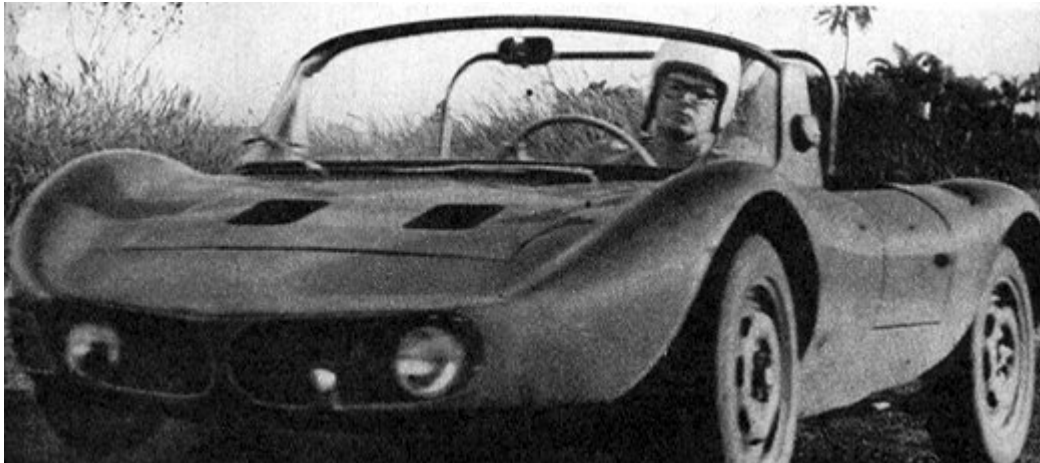
Carro de corrida de Curitiba, mecânica DKW

Como não verei, vou fazer um galpão para colocar os meus. Projeto para 2008. E a blogaiada vai participar, claro. Afinal, não tenho arquiteto, nem engenheiro. Concurso à vista! Falaremos disso nas próximas semanas.