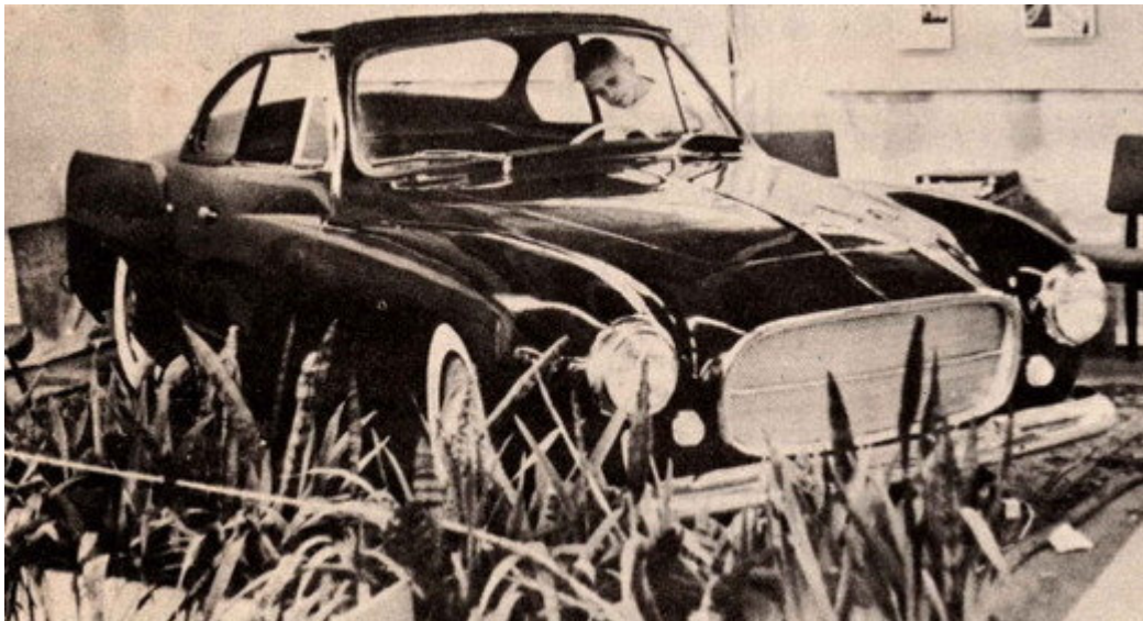
Salão do Automóvel de 1960, mecânica DKW, nada mais se sabe