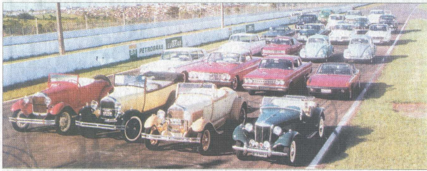
Frota de veículos do Clube do Carro Antigo: paixão dos aficionados