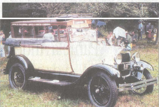
Ford antiga que foi utilizado nas cenas do filme "Gaijin 2" realizado em Londrina