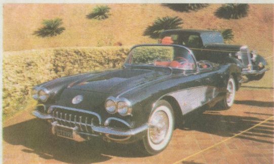
Chevrolet Corvette 1958 – Sérgio M. Prosdócimo

Museu Histórico de Londrina viveu dias de confraternização entre antigomobilistas