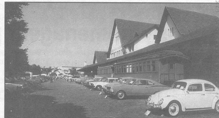
Ocorreu no pátio do Museu Padre Carlos Wais, no centro de Londrina

estados. O próximo passo é a construção do Museu Norte Paranaense de Veículo Antigo, fadado a ser um dos mais modernos clubes do país.