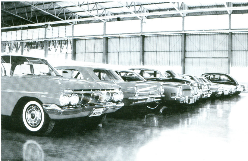
O clube tem atualmente 68 carros antigos que pertencem a 28 associados. Na foto, alguns deles.

E atenção para os próximos eventos: de 11 a 15 de abril, em águas de Lindóia, o Encontro de Autos Antigos e Motos Clássicas. De 21 a 22 de abril, em São Marcos, RS, novo encontro de carros antigos. Os londrinenses lá estarão prestigiando os dois acontecimentos.