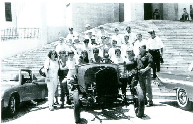
Homens e mulheres fazem parte da acolhedora agremiação